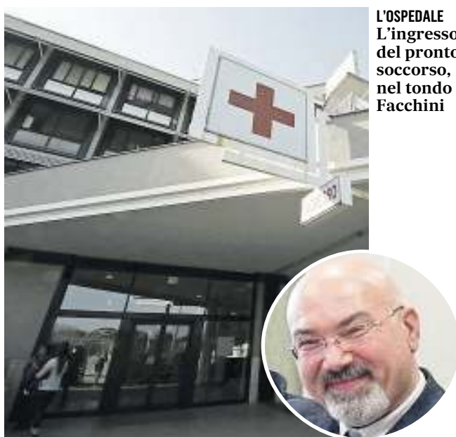
L'OSPEDALE L'ingresso del pronto soccorso, nel tondo Facchini