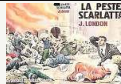
LA COPERTINA Il romanzo breve